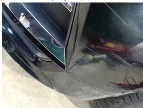
Bouclier avant (Rayure)