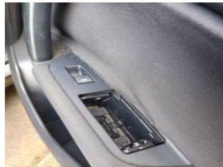
Porte arrière droite (Autre Défaut)