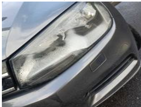
Phare avant gauche (Rayure)