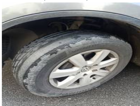
Pneu avant gauche (Usure 75%)