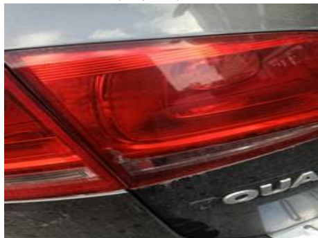
Phare arrière gauche (Impact)