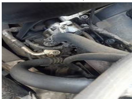
Moteur (Autre défaut)