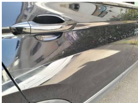
Porte arrière droite (Rayure)