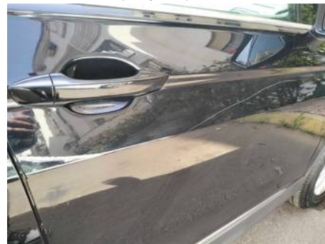
Porte avant droite (Rayure)