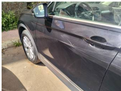
Porte avant gauche (Rayure)