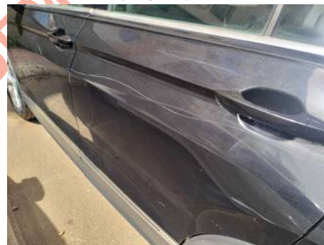
Porte arrière gauche (Rayure)