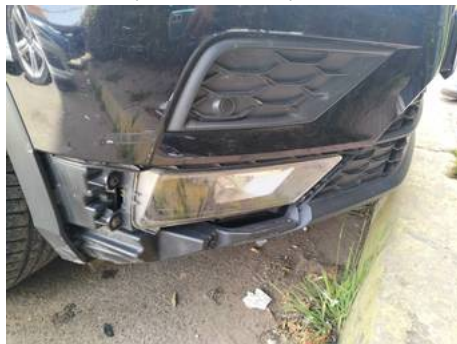
Bouclier avant (Autre Défaut)