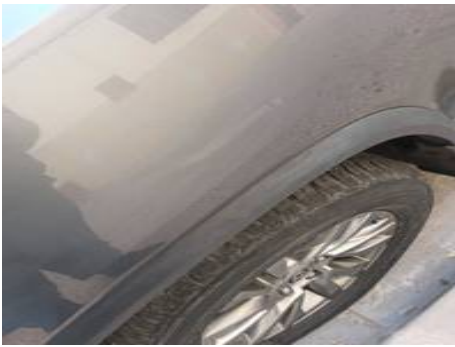
Aile avant gauche (Rayure)