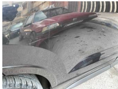
Porte arrière droite (Rayure)