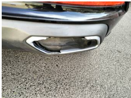
Bouclier arrière (Impact)