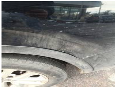
Aile arrière gauche (Rayure)