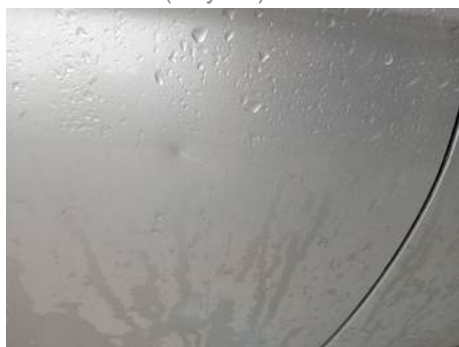
Porte avant droite (Rayure)