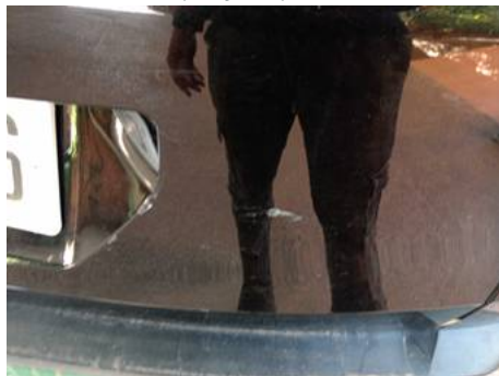
Bouclier arrière (Impact)