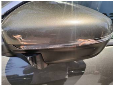
Rétroviseur extérieur gauche (Rayure)