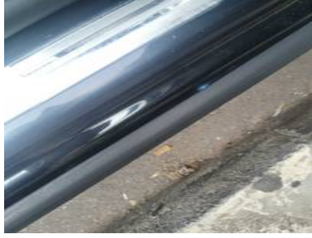
Bas de caisse droite (Autre Défaut)