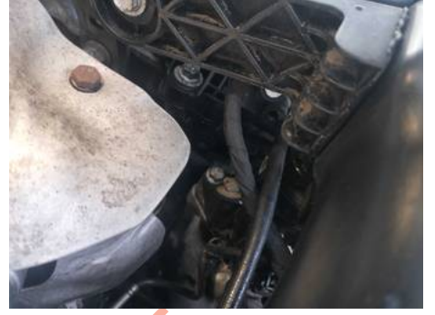
Moteur (Fuite d'huile)