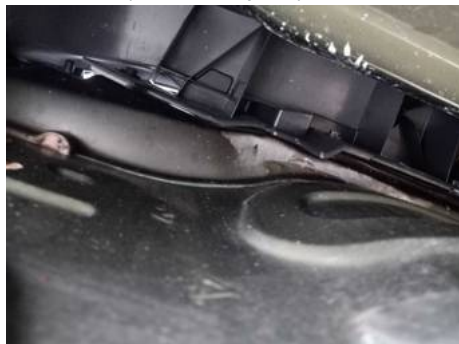
Bouclier arrière (Défaut aspect)