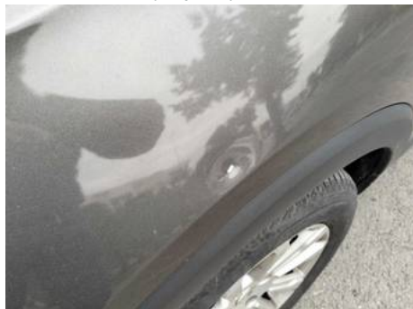
Aile avant gauche (Impact)