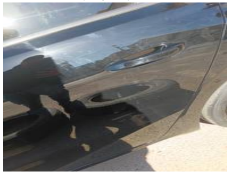
Porte arrière gauche (Rayure)