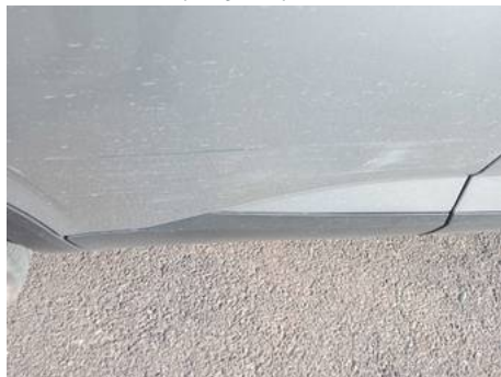
Porte arrière droite (Rayure)