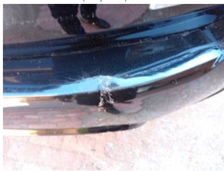
Bouclier arrière (Impact)