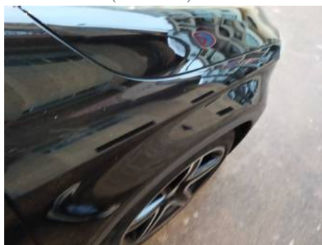
Aile avant droite (Peinture)