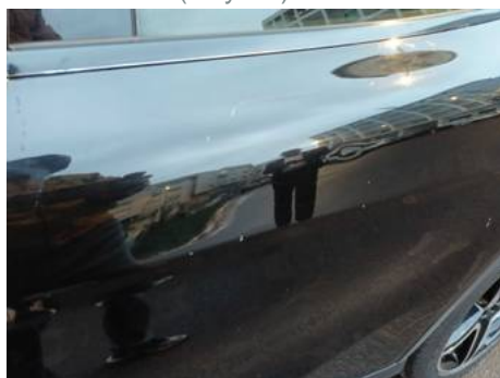
Porte arrière gauche (Rayure)