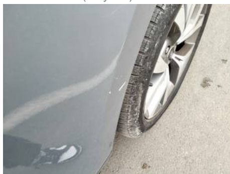
Porte arrière gauche (Rayure)