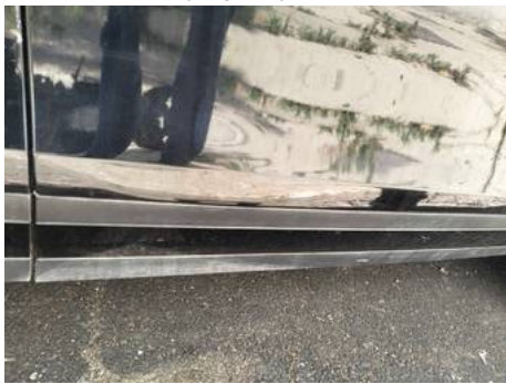
Porte avant droite (Impact)