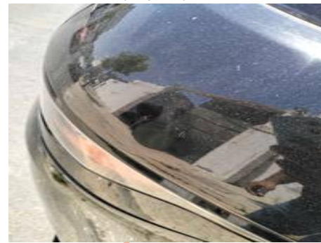
Aile arrière droite (Impact)