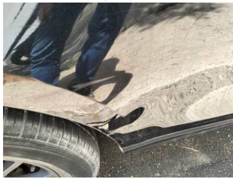
Porte arrière droite (Impact)