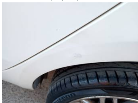
Aile arrière gauche (Impact)