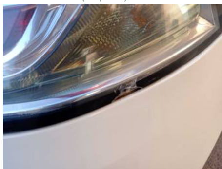
Phare arrière droit (Impact)