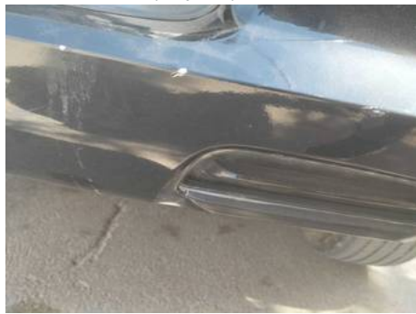
Bouclier arrière (Impact)