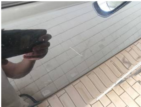
Porte avant droite (Rayure)