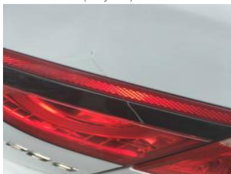
Phare arrière droit (Rayure)