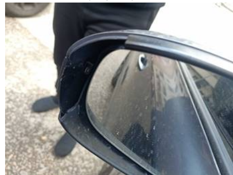
Rétroviseur extérieur gauche (Impact)