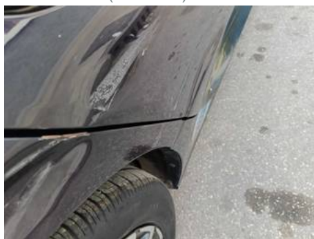
Porte arrière droite (Peinture)