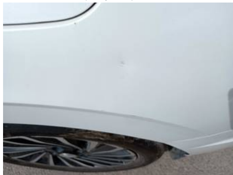
Aile arrière gauche (Rayure)