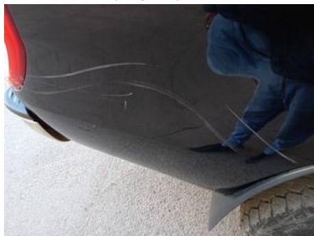
Aile arrière droite (Rayure)