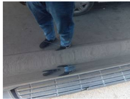
Porte arrière droite (Rayure)