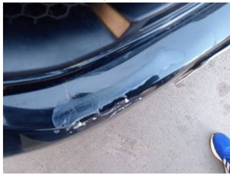
Bouclier avant (Rayure)