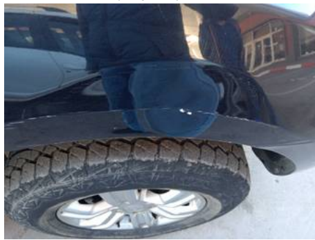
Aile avant droite (Impact)