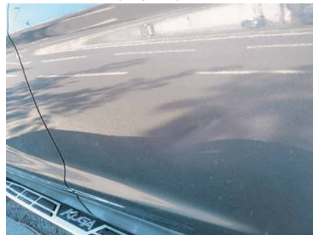
Porte avant droite (Impact)