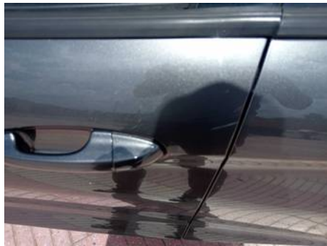
Porte avant gauche (Rayure)