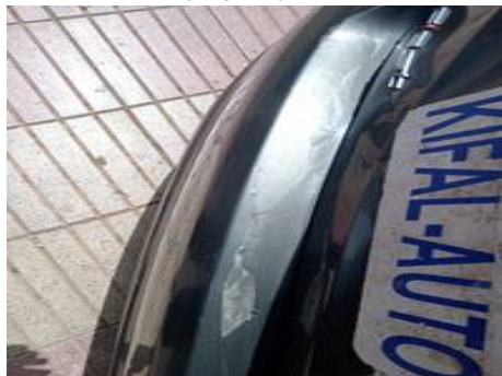
Bouclier arrière (Impact)