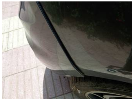
Bouclier arrière (Défaut aspect)