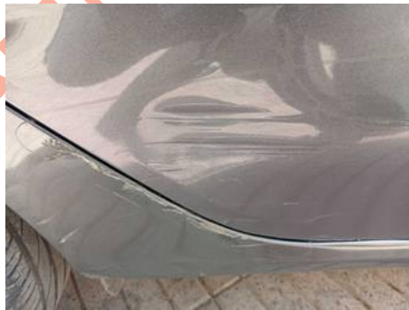
Porte arrière droite (Impact)