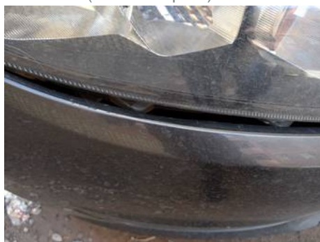
Bouclier avant (Défaut aspect)