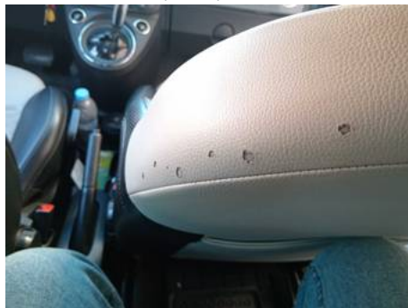
Garniture de siège avant (Trou)