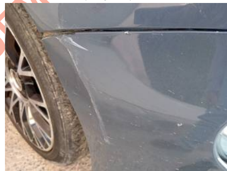
Bouclier avant (Rayure)