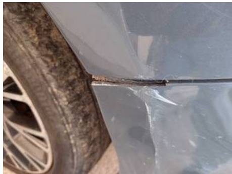
Bouclier avant (Défaut aspect)