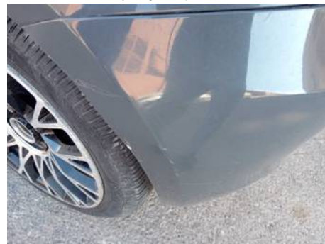
Bouclier arrière (Rayure)