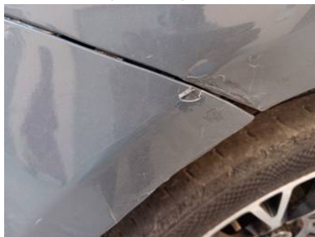
Bouclier arrière (Peinture)