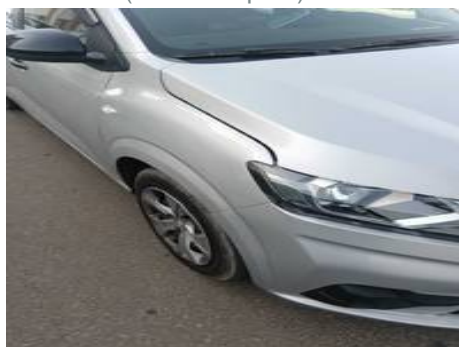
Aile avant droite (Défaut aspect)