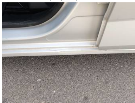
Bas de caisse gauche (Impact)