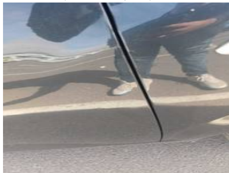
Porte avant droite (Défaut aspect)