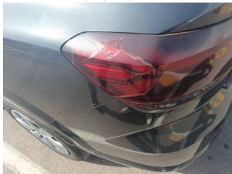
Phare arrière gauche (Impact)