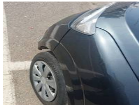
Porte avant gauche (Impact)