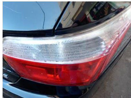
Phare arrière droit (Présence de rouille)