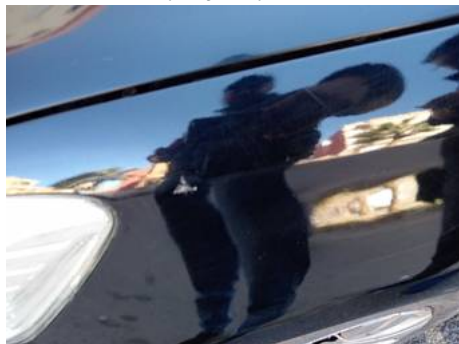
Aile avant gauche (Rayure)