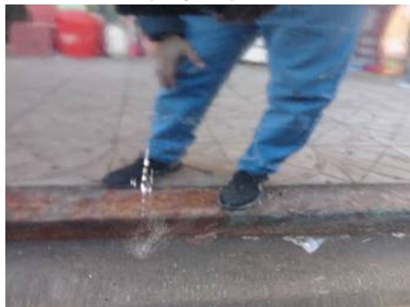
Porte avant droite (Rayure)