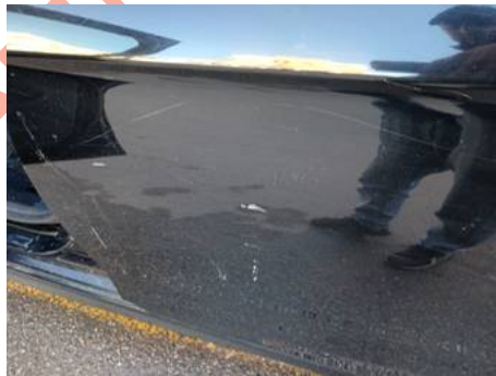
Porte arrière gauche (Rayure)