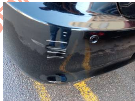
Bouclier arrière (Rayure)