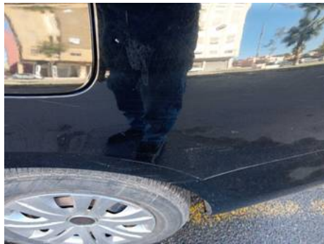
Aile arrière gauche (Rayure)