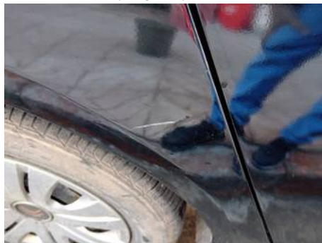
Aile arrière droite (Rayure)