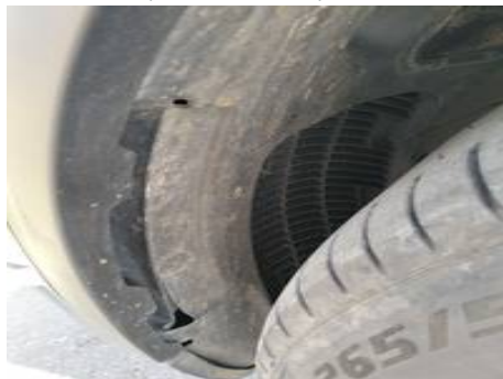
Bouclier avant (Autre Défaut)