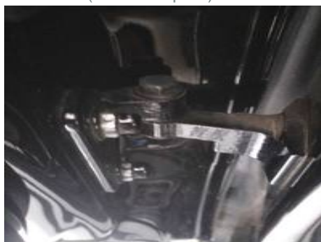
Porte avant gauche (Défaut aspect)