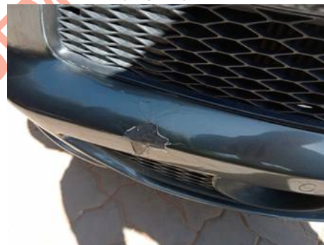
Bouclier avant (Impact)