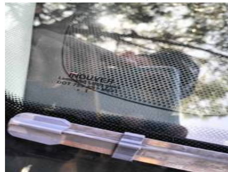
Pare-brise (Autre Défaut)